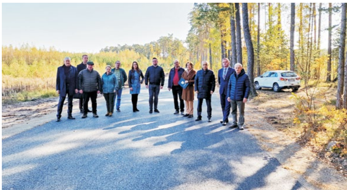
Droga powiatowa Nowe Miasto - Ułów w msc. Waliska