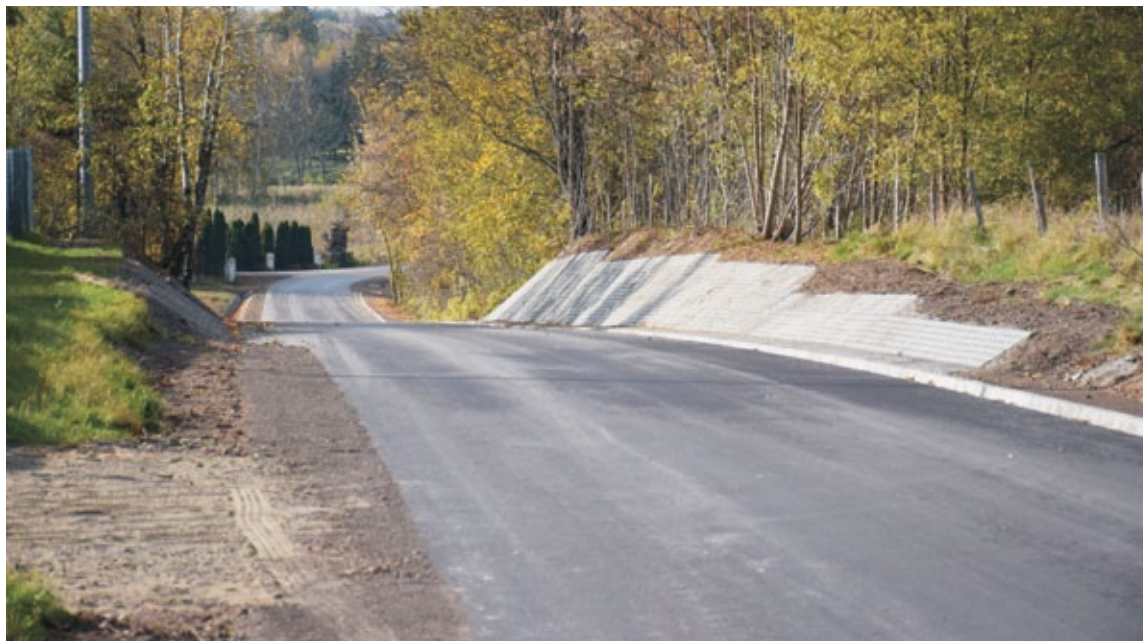
Droga powiatowa Fałęcice - Nowe Miasto w msc. Gostomia

Wartość przedsięwzięcia, to 968 353,92 zł. Inwestycja została sfinansowana z budżetów Powiatu Grójcekiego oraz Gminy Nowe Miasto nad Pilicą w podziale kosztów 50%/50%.