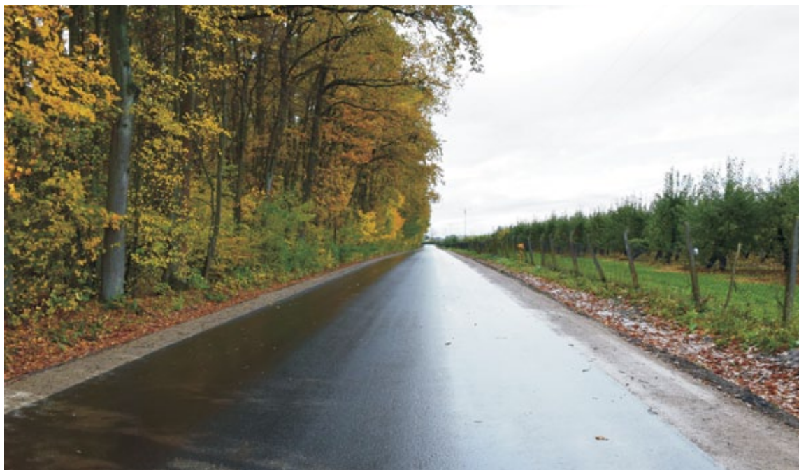
Droga powiatowa Dobryszew - Trzylatków w msc. Rosochów