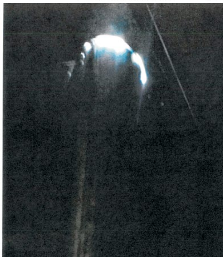
Fotografia nr 13 - brak uszczelnienia i kołnierza wokół rury wywiewnej. (Zdjęcia z ekspertyzy)