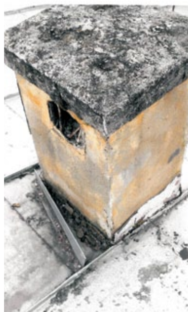
Fotografia nr 6 - jednoprzepływowy komin wentylacyjny, brak kratki w otworze wentylacyjnym