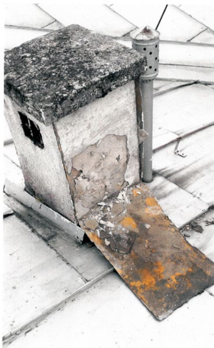
7. Fotografia nr 7 – jednoprzewodowy komin wentylacyjny z odpadającym tynkiem wykonanym z kleju na siatce. 8 lut 2023, 11:35